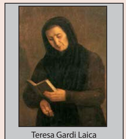
Teresa Gardi Laica

I herojske kreposti Službenice Božje Terezije Gardi, laikinje, iz Trećeg reda svetoga Franje, koja je rođena u Imoli (Italija) 22. listopada 1769. i ondje preminula 1. siječnja 1837.